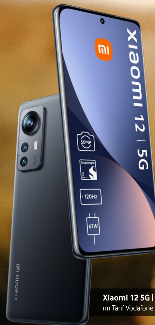
Xiaomi 12 5G | 256 GB im Tarif Vodafone Smart XL 1