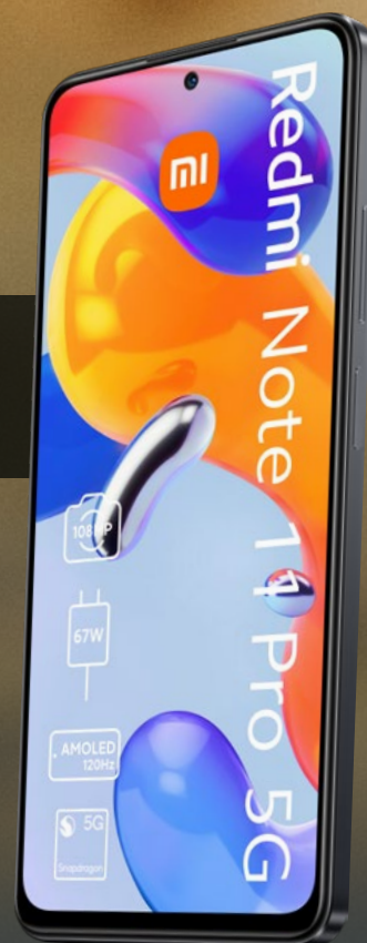
Xiaomi Redmi Note 11 Pro 5G | 128 GB im Tarif OteLo Allnet Flat Classic 3