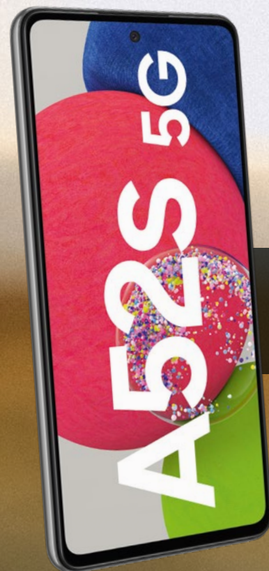
Samsung Galaxy A52s 5G | 128 GB im Tarif OteLo Allnet Flat Max 4

19,99 € /mtl. 3 (zzgl. eventuell anfallendem Gerätepreis)